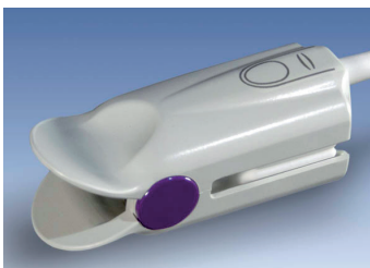
Stabiler Finger-Clip für Patienten über 20 kg.

Respirations-Rate: Meßbereich: 0 - 150 Atemzüge/min Mittelwertbildung: 4 Atemzüge Durchschnitt