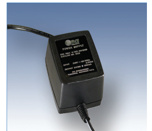
Starkes Netzteil für den Dauerbetrieb.