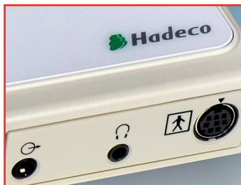
Sondenbuchse und Signalausgang