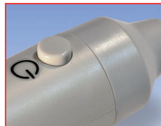
Handlicher Sondentaster für Ein/Aus